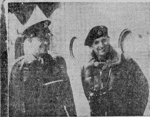
General Dwight D. Eisenhower, Supreme Allied Commander (left), and general Sir Bernard L. Montgomery, Commander of Allied forces in the invasion group, are pleased with progress of the invasion as they cross the Channel on a Allied warship.

According to the latest news at hand, the Germans did not destroy as much in Cherbourg as they did in some of the Italian ports taken by the Allied ar-