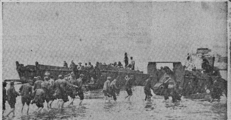
Vigilados por soldados de los Estados Unidos prisioneros nazis hechos en la campaña de Normandía vadean hasta las barcazas que los conducirán a Inglaterra para ser internados en campamentos.